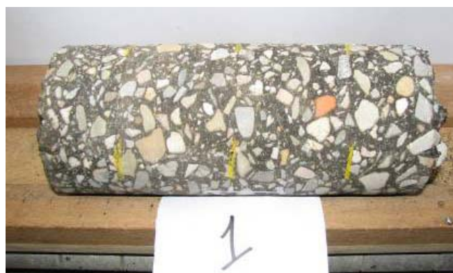
Foto: Een boorkern voor laboratoriumonderzoek

Als de uitkomst van de proef is dat asfalteren bij lage temperaturen kan met behoud van kwaliteit en zonder het naastliggende asfalt te beschadigen, dan zou vorstschade voortaan sneller gerepareerd kunnen worden. De resultaten van de proef worden verwacht voor de zomer van dit jaar. Rijkswaterstaat kan dan bij een volgende strenge winter beschikken over meer opties om vorstschade te lijf te gaan met minder verkeershinder.